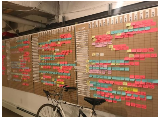
↳사무실 벽면이 스케줄표로 빼곡함

올해 센터스테이지로 한국팀 2공연이 진행이 되었고, 관객반응이 너무 좋았음. 한국의 잔다리 페스타와 협력관계가 잘 되고 있어서 올해도 한국팀을 보기 위해 잔다리 페스타에 방문할 예정임. 매년 게스트 큐레이터를 섭외하여 페스티벌의 전반적인 프로그램을 진행하고 있으며, 아티스트 초청의 경우 지원서를 받기도 하지만 대다수 직접 본 공연을 초청하는 경우가 많음. 작은규모로 운영하고 있어서 정규직원은 2명이며, 페스티벌 기간내에 임시채용을 하고 자원봉사자들의 도움을 많이 받고 있음