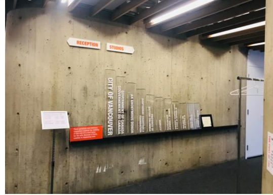
↳ 사무실을 DOXA 다큐멘터리 필름 페스티벌, Touchstone Theatre, Music on Main과 함께 110 Arts Cooperative라는 이름으로 함께 사용